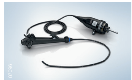
Wideobronchoskop Olympus BF-H1100

W związku z ciągłym rozwojem wiedzy medycznej mogą być konieczne modyfikacje techniczne lub zmiany w projekcie lub specyfikacji produktu i akcesoriów.